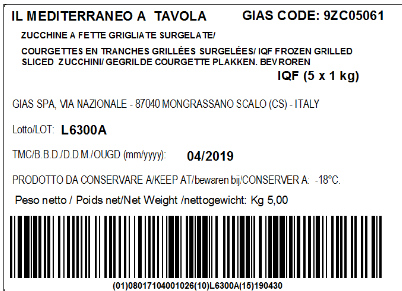
Figura 3: Esempio di etichetta - tracciabilità pallet: